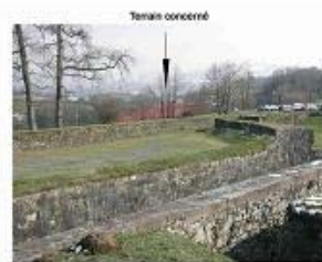
Vue depuis la citadelle